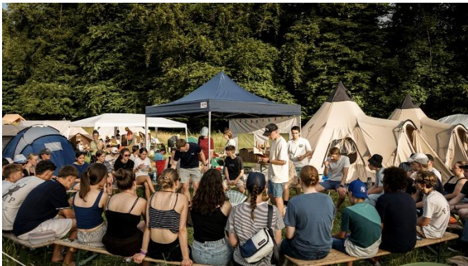
Eine grosse Gruppe von Teenies und Jugendlichen besuchte Mitte Juni das Melo-Festival auf Chrischona.

Im Monat Mai durften wir ein grosses Zeichen der Grosszügigkeit erleben: Sagenhafte 63'000 CHF sind zusammengekommen! Dank dieser überwältigenden Unterstützung konnte ein bedeutender Teil unseres Rückstands aufgeholt werden. Herzlichen Dank an alle, die mitgetragen, gebetet und gespendet haben – eure Treue und Verbundenheit berühren und ermutigen uns zutiefst!