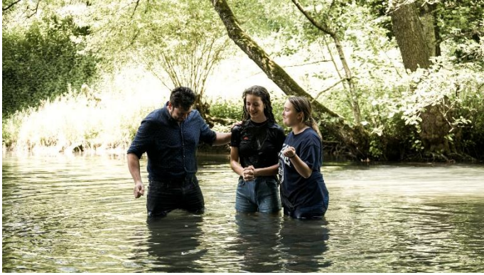
Am 1. Juni durften wir fünf Personen im Aabach taufen. Jedes Mal erschallte ein lautes: Jesus ist Herr!