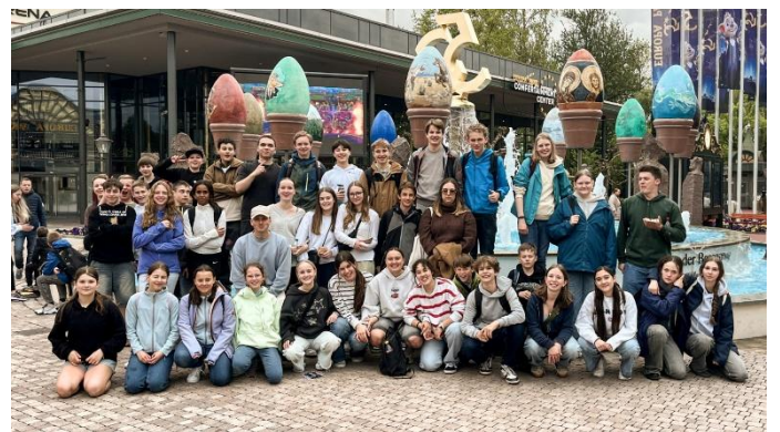
Ein Car voll junger Leute besuchte Ende April gemeinsam den Europapark.