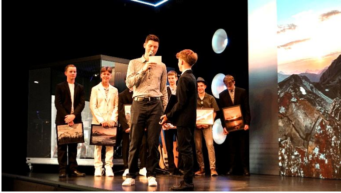
Am 11. Juni durften wir die elf Teenies feierlich segnen. Die Lifegroup-Leiter sprachen «ihren» jungen Leuten den Segen zu.